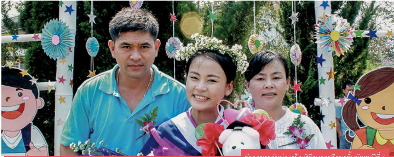
อัจฉราพรกับพ่อแม่ในพิธีจบการศึกษาชั้นมัธยมปีที่ 6