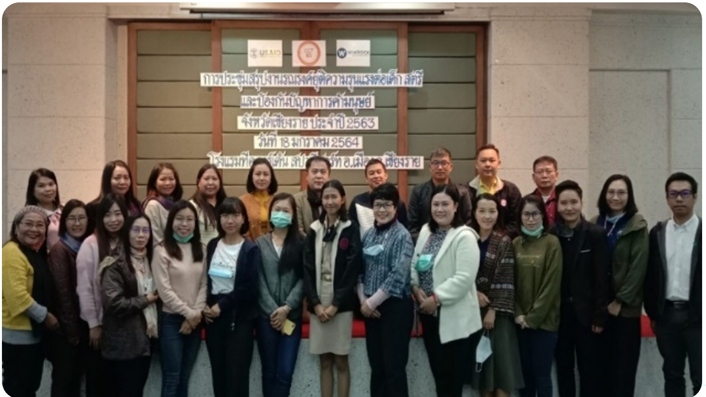
รูปที่ 4 คณะ คปค. และผู้มีส่วนได้ส่วนเสียระดับจังหวัดเข้าร่วมประชุมในจังหวัดเชียงราย เพื่อทบทวนผลการจัดกิจกรรมบรรณรักษ์เพื่อยุติความรุนแรงต่อสตรี เด็ก และการค้ามนุษย์