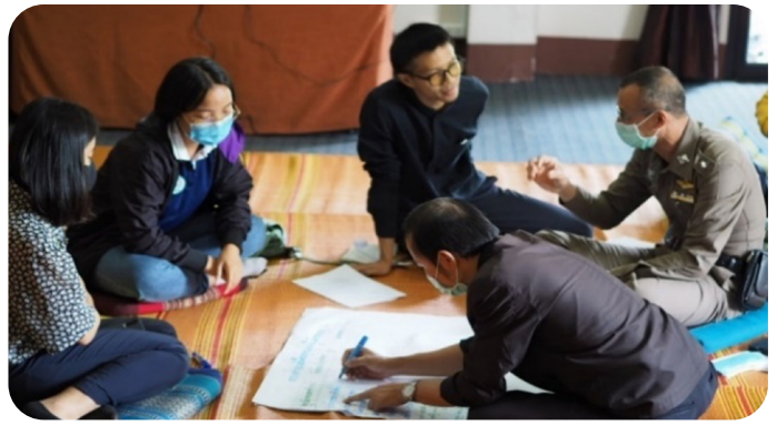
รูปที่ 2 การประชุมถอดบทเรียนของทีมสหวิชาชีพที่จัดขึ้นโดยสมาชิก คปค. และเจ้าหน้าที่ภาครัฐในระดับท้องถิ่นในจังหวัดเชียงรายเมื่อเดือนมิถุนายน พ.ศ. 2563

หลังจากที่ได้ดำเนินงานร่วมกันมาเป็นเวลา 1 ปี องค์กรสมาชิกของ คปค. ทั้ง 14 แห่ง จึงจัดทำและร่วมลงนามในบันทึกข้อตกลงความร่วมมือ (MoU) เมื่อวันที่ 18 กันยายน พ.ศ. 2562 และจัดให้มีการฝึกอบรมเพื่อเสริมสร้างศักยภาพในการดำเนินงานแบบสหวิชาชีพให้แก่องค์กรสมาชิก ก่อนการลงนามใน MoU คณะกรรมการขับเคลื่อนได้รับมอบหมายให้ทำหน้าที่