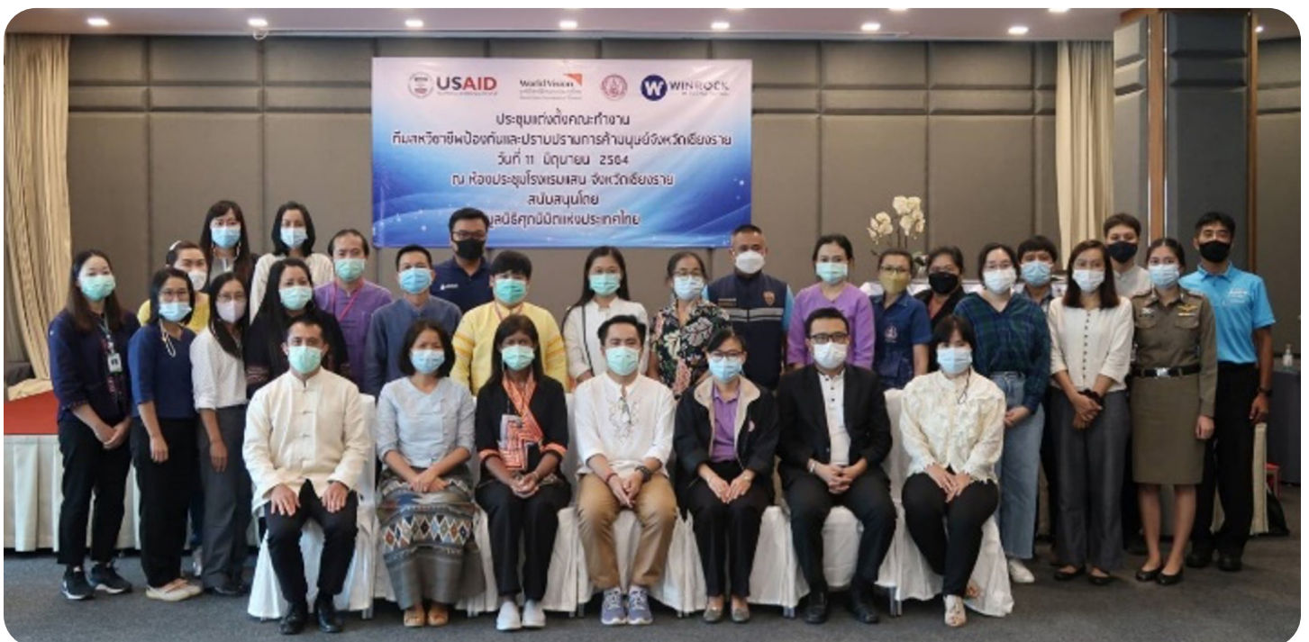
รูปที่ 1 สมาชิก คปค. และเจ้าหน้าที่ภาครัฐระดับท้องถิ่นที่ได้รับแต่งตั้งให้เป็นคณะทำงานกับสหวิชาชีพโดยผู้ว่าราชการจังหวัดเชียงราย

ภายใต้โครงการต่อต้านการค้ามนุษย์ในประเทศไทยสนับสนุนโดยองค์การเพื่อการพัฒนาระหว่างประเทศของสหรัฐอเมริกา (USAID) ในระหว่างปี พ.ศ. 2561-2564 มูลนิธิศุภนิมิตและพันธมิตรภาคประชาสังคมร่วมมือกับพันธมิตรท้องถิ่นในจังหวัดเชียงรายในการจัดตั้งคณะกรรมการประสานงานองค์กรภาคประชาสังคม เพื่อคุ้มครองเด็ก สตรี และต่อต้านการค้ามนุษย์ในจังหวัดเชียงราย (คปค.) ขึ้น ทั้งนี้ ในจังหวัดเชียงรายมีองค์กรภาคประชาสังคมมากกว่า 30 แห่ง ที่ทำงานร่วมกับกลุ่มเปราะบาง รวมถึงกลุ่มชาติพันธุ์ บุคคลไร้รัฐไร้สัญชาติ แรงงานข้ามชาติ ผู้หญิง และเด็ก ซึ่งหลายองค์กรมีเป้าหมายและวัตถุประสงค์ที่คล้ายกัน ตลอดจนดำเนินงานเพื่อกลุ่มเป้าหมายและพื้นที่เดียวกัน อย่างไรก็ตาม ในอดีตที่ผ่านมาการประสานงานระหว่างองค์กรเป็นไปอย่างจำกัด โดยองค์กรส่วนใหญ่มักจะทำางร่วมกับพันธมิตรตามความพึงพอใจหรือพันธมิตร