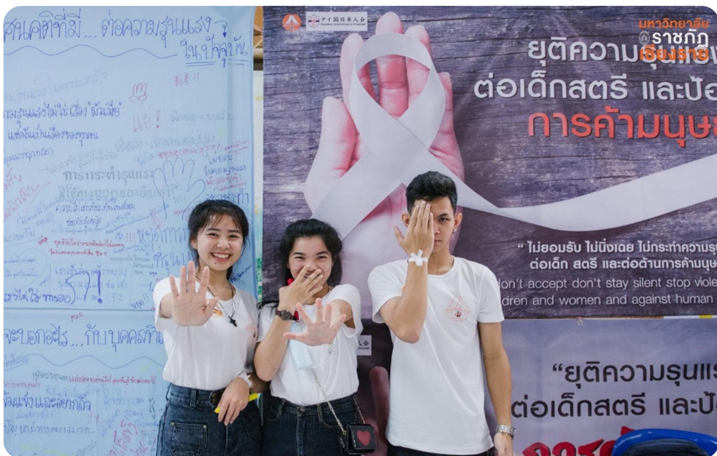
รูปที่ 3 เยาวชนผู้เข้าร่วมกิจกรรมการรณรงค์ยุติการค้ามนุษย์ที่จัดขึ้นและบริหารจัดการโดย คปก. ในจังหวัดเชียงราย